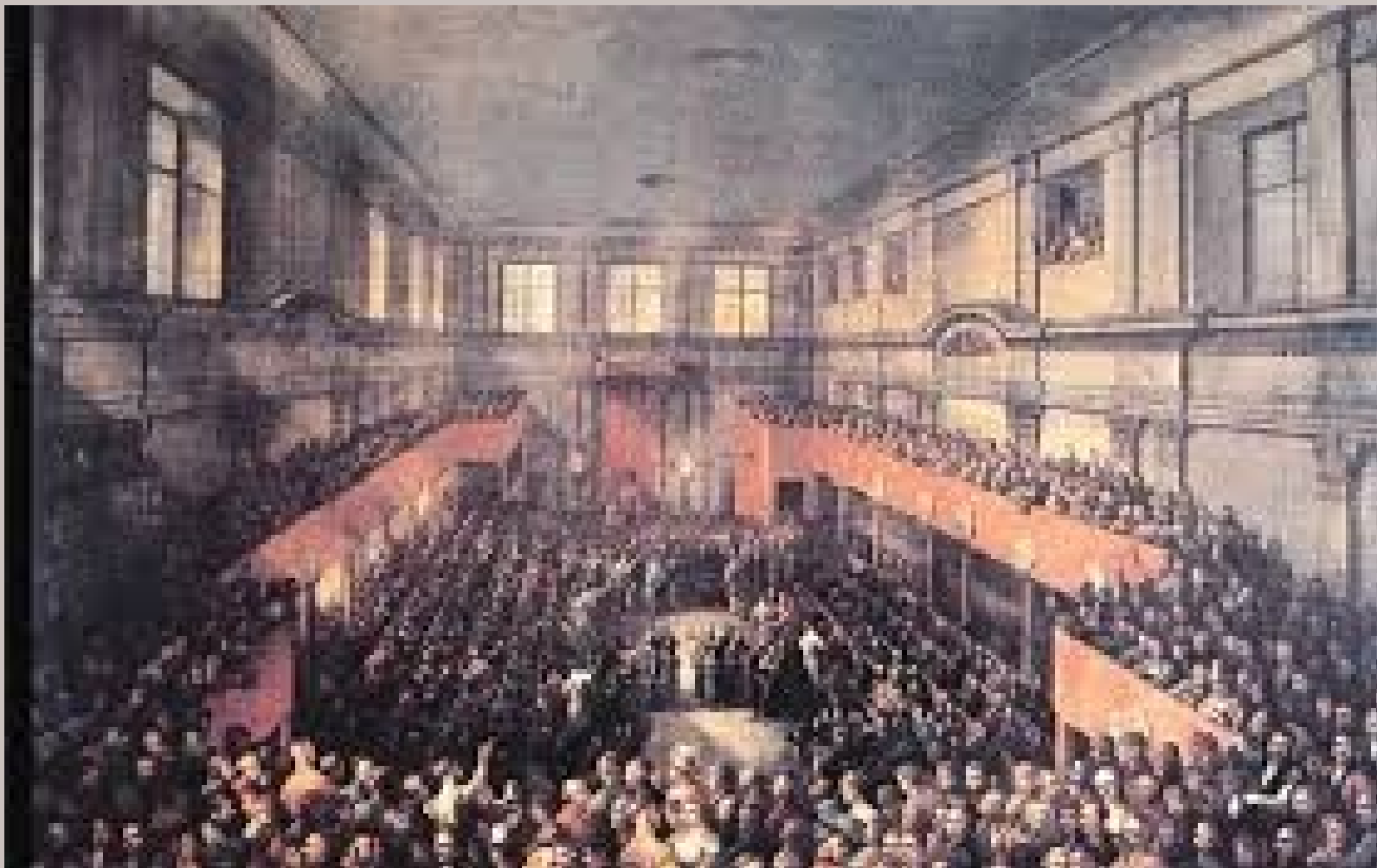
OBRADY SEJMU WIELKIEGO