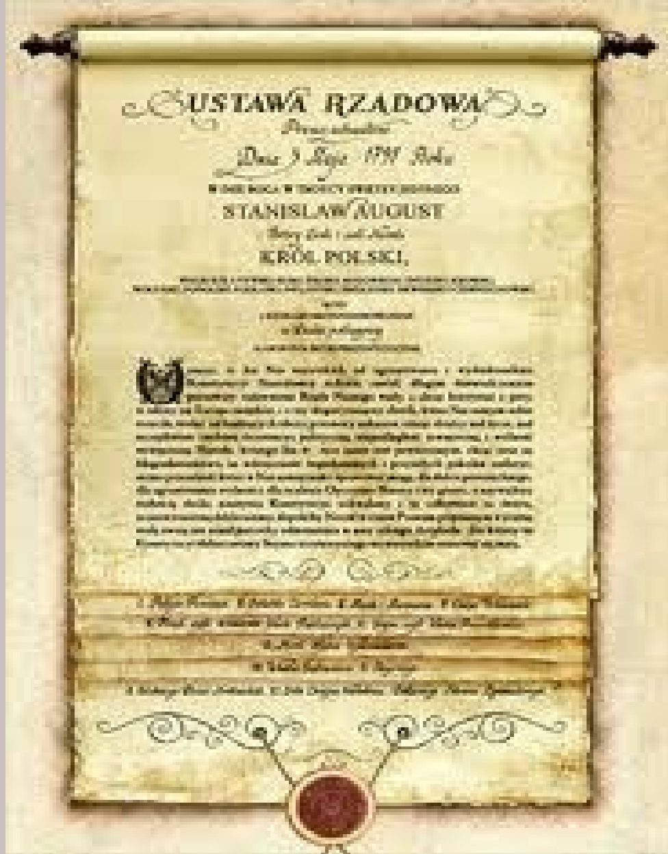
TEKST KONSTYTUCJI 3 MAJA